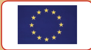
European Union / Union Européenne / União Europeia