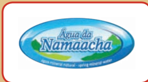
Águas de Namaacha