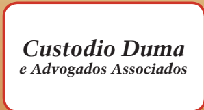
Custódio Duma & Associados